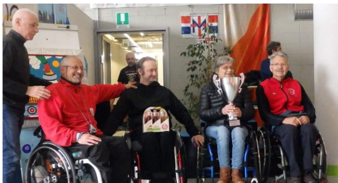
2016 Tournoi de Turin 3ème place

Mireille tu nous manques, « les petits sirops » pensent toujours à toi. Tu restes dans nos cœurs à jamais.