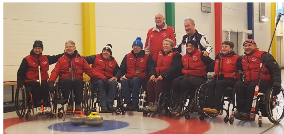
Lausanne Olympique 1 et 2 au Championnat Suisse à Genève