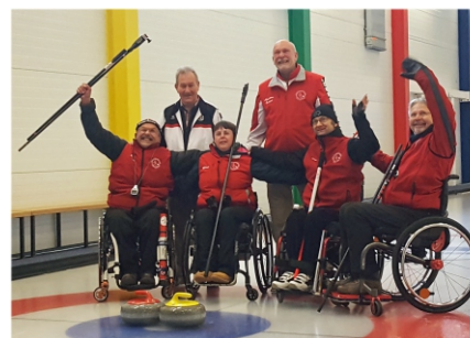
Lausanne Olympique 1