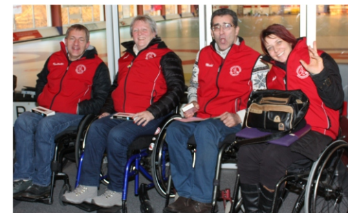
Lausanne Olympique 2